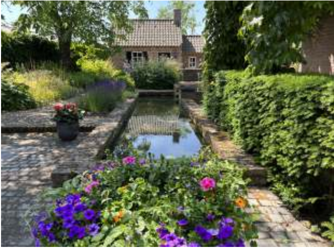
Open tuinen 11 juni 2023: Een drukbezocht evenement!

Tijdens deze 'open tuinen' dag, dit jaar gehouden in Heusden, Asten en Ommel, hebben we weer prachtige tuinen mogen bezichtigen! Ondanks het warme weer en een briesje hebben zo'n 100 bezoekers de tuinen bezocht.